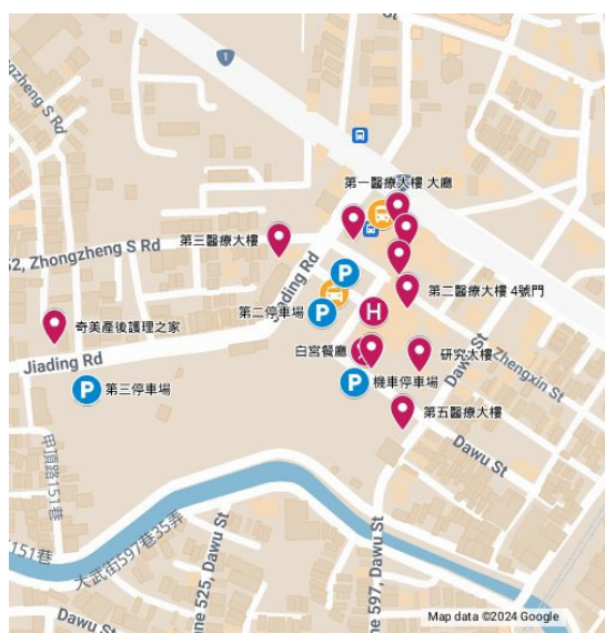
▲奇美醫院-院區地圖導覽