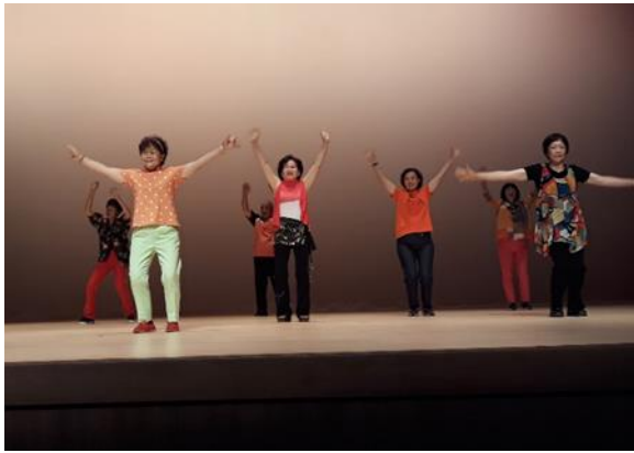
說明：志工伙伴踴躍參加樂齡工作坊，樂學習、勇於表現