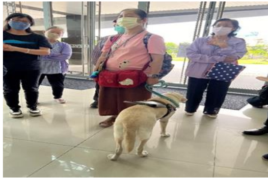
說明：台江文化中心以友善場館為營運方向，邀請台灣導盲犬協會高雄辦公室講師為志工分享了解導盲犬執勤注意事項，以提供更符合視障者需求之服務(6月1日)