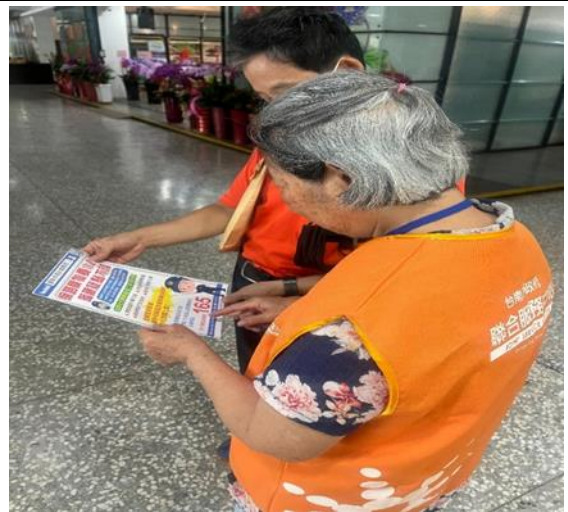
志工主動向洽公民眾宣導反詐資訊