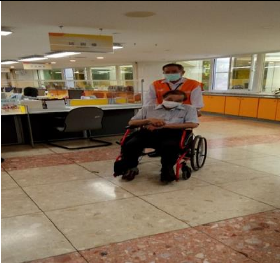
協助民眾輪椅推送