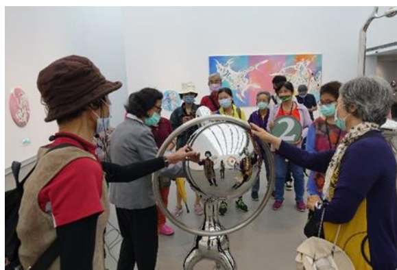
說明：辦理高雄美術館文化參訪，提升志工美學鑑賞能力