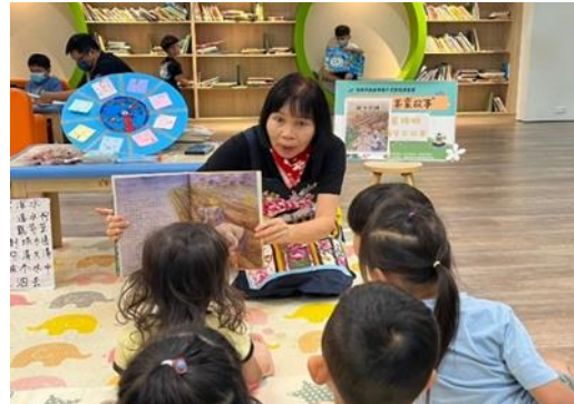
說明：台江文化中心圖書館說故事志 工講述繪本