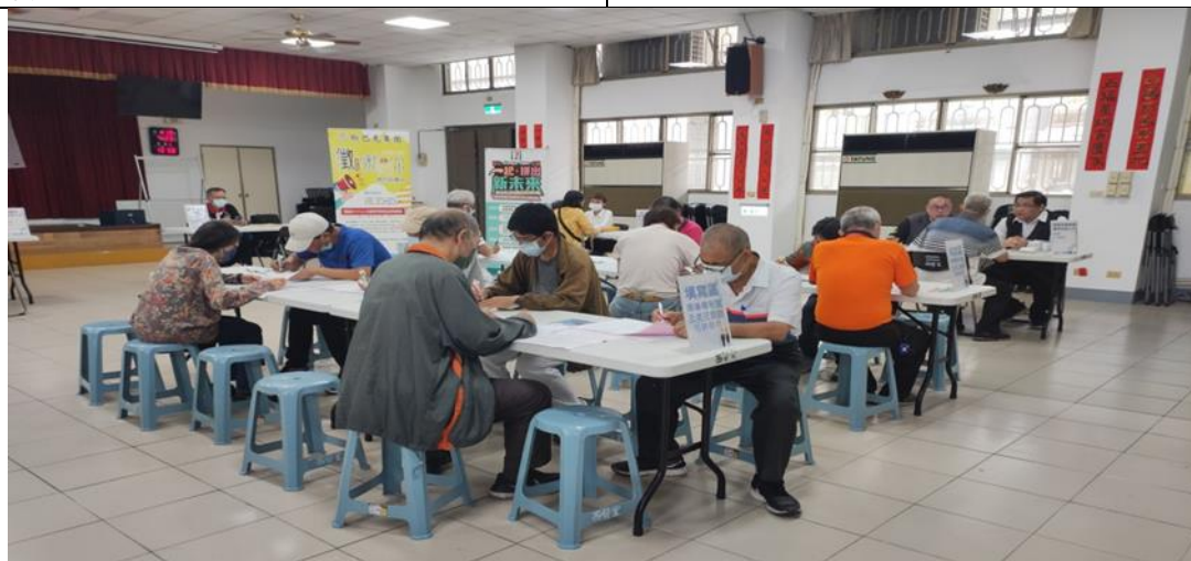
照片說明：本市銀髮人才服務據點辦理徵才活動