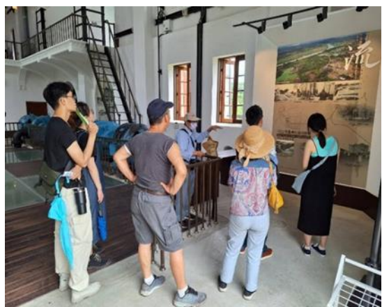
說明：水道博物館志工導覽服務