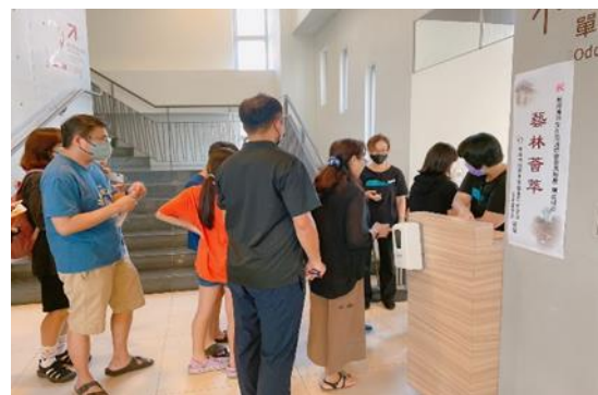
說明：台江文化中心劇場組志工演出值勤