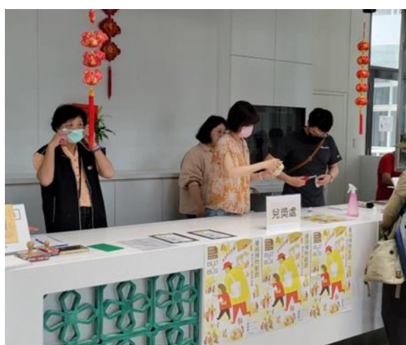
說明：台南市立博物館國際博物館日於5月18日、5月19日，高齡文化志工協助博物館逛大街