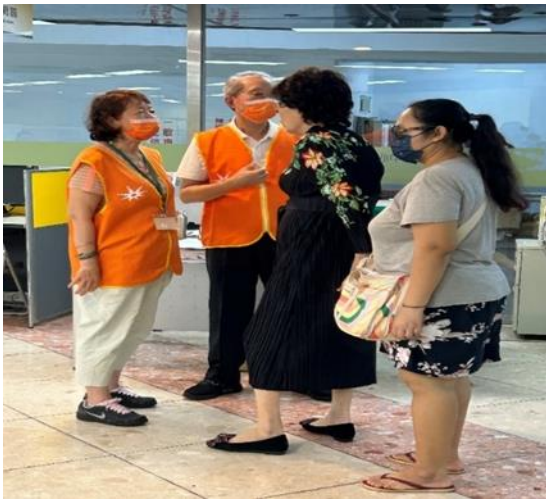
市政業務諮詢及引導

二、永華及民治聯合服務中心志工共 62 人，其中 65 歲以上高齡志工 54 人(87%)，113 年上半年度服務洽公民眾共計 9,725 人次。