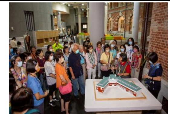
說明：台南文化中心志工參訪台灣文學館