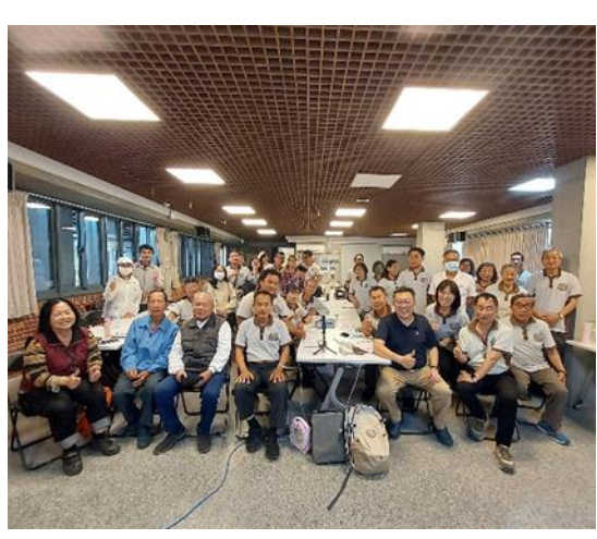
說明：左鎮化石園區辦理文化志工教育訓練-專題講座