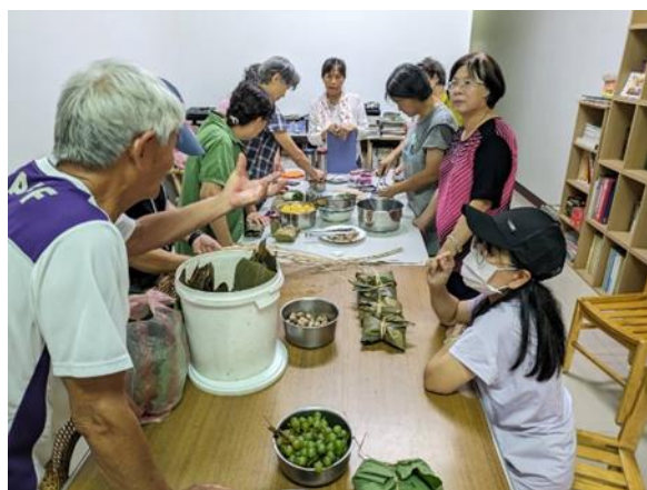
說明：噍吧哖事件紀念園區高齡文化志工參與歷史餐食創作