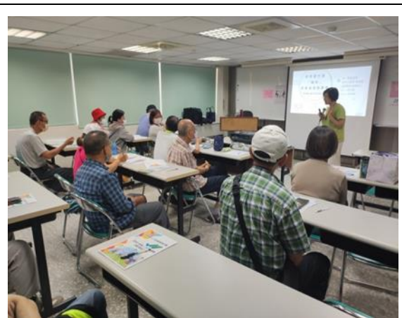
照片說明：113年辦理銀髮就業促進講座