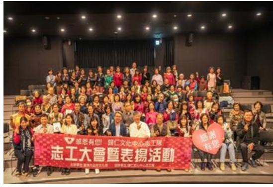
說明：歸仁文化中心於 2/18 辦理志工大 會