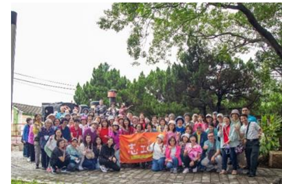
說明：台南文化中心志工 參觀虎尾糖廠