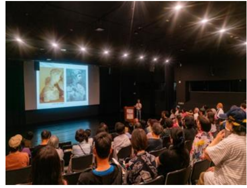
說明：歸仁文化中心辦理志工藝術與 人文系講座：美感經驗的建立與認知