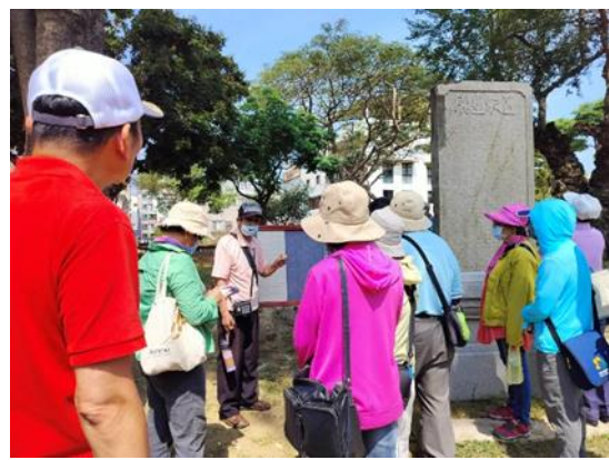
說明：古蹟營運高齡志工擔任課程講師