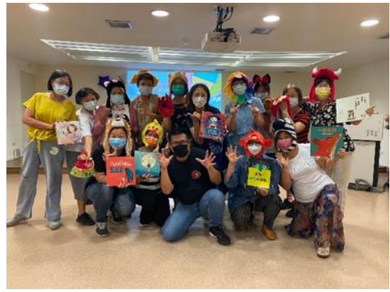
說明：袋鼠媽媽說故事，帶領小朋友進入繪本的世界