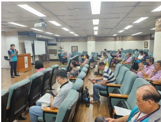
說明：古蹟營運高齡志工心得分享