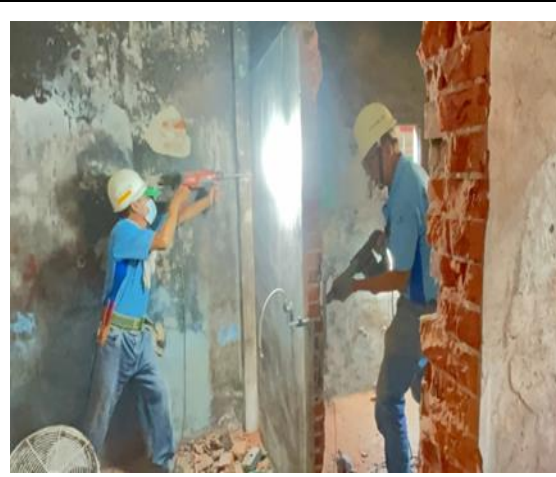
照片說明：泥水志工房屋修繕作業。