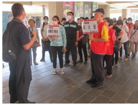
說明：台南文化中心志工參加 113 年上半年志工消防演練(4月20日)