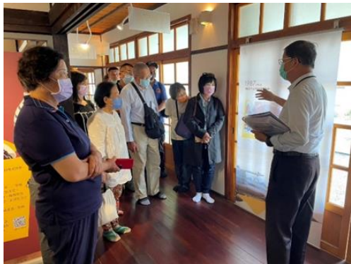
說明：水交社文化園區 4/29 歷史與文化走讀