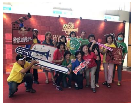
說明：新化演藝廳志工支援「2024 台 南管樂藝術節活動」