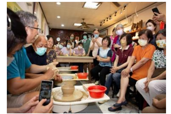
說明：台南文化中心志工 參加陶藝工作坊