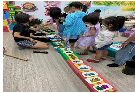
說明：歸仁文化中心推廣組志工協助 週日兒童故事屋活動，玩繪本、做手 作