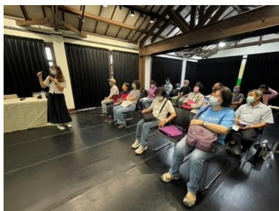
說明：水交社文化園區健康講座