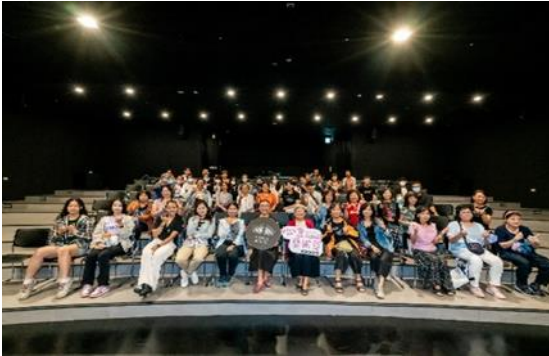
說明：歸仁文化中心辦理志工藝術與人文 系講座：用舞蹈譜寫文化的故事