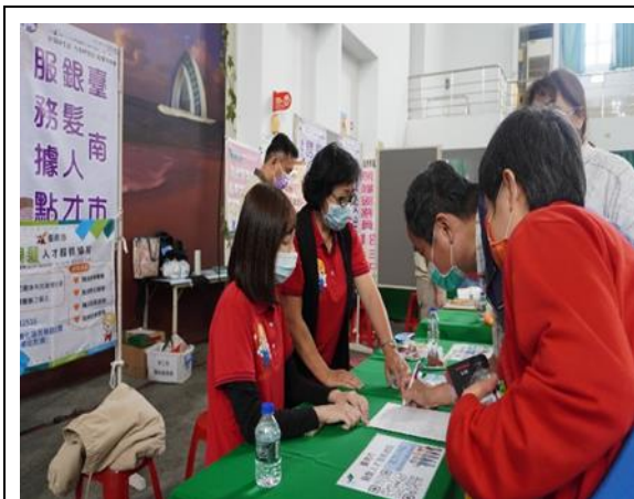
照片說明：於就業博覽會設置「中高齡就業諮詢專區」