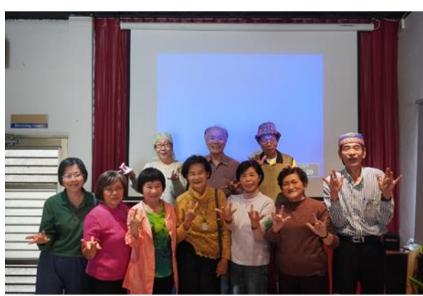
說明：水交社文化園區志工大會