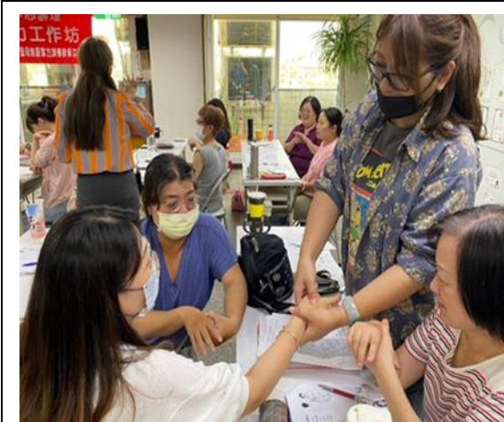
照片說明：失業者職業訓練-美容美體芳療實務班上課照片。