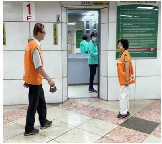
市政業務申辦樓層引導