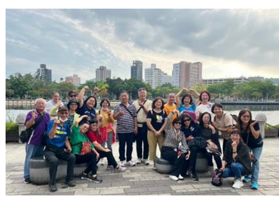
說明：志工開心參與年度文化參訪，凝聚志工向心力，成長精進學習