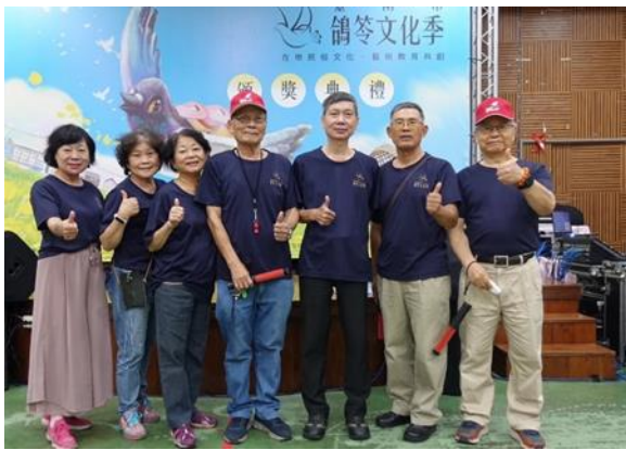
說明：志工伙伴熱心協助 2024 鴿苓文化季頒獎典禮