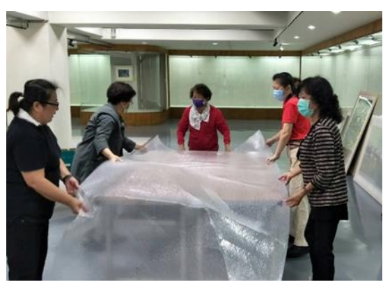
說明：展覽志工協助藝術家卸佈展，不畏辛勞