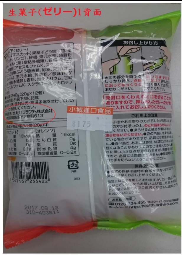
群馬縣蒟蒻產品大包裝未有中文標示(背面)