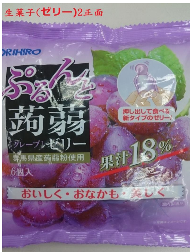
群馬縣產品小包裝蒟蒻未有中文標示(正面)