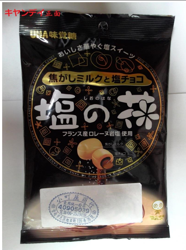
福島縣糖果產品未有中文標示(正面)