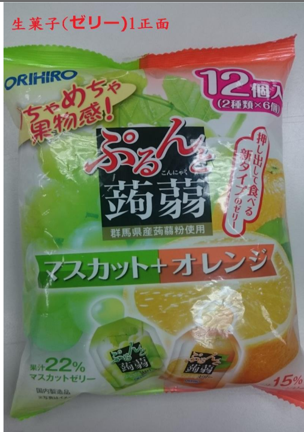
群馬縣蒟蒻產品大包裝未有中文標示(正面)