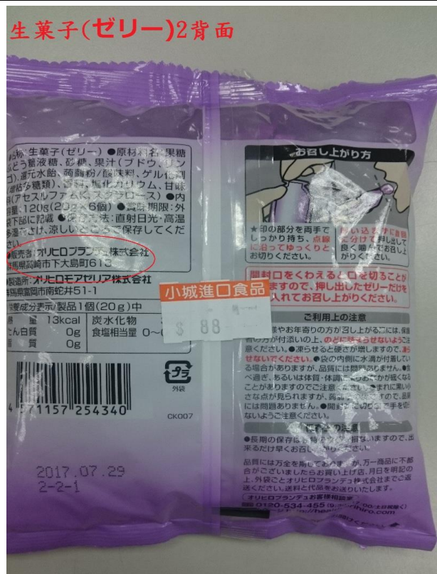
群馬縣蒟蒻產品小包裝未有中文標示(背面)