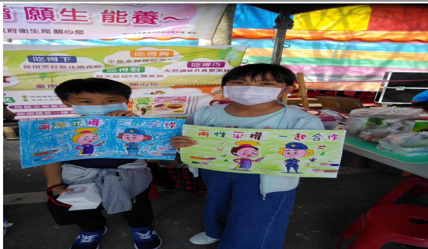
兩性平權著色比賽