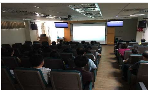
研習會實況剪影(視訊)