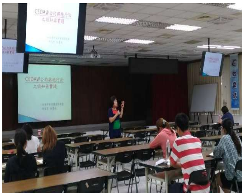
研習會實況剪影(多點視訊)